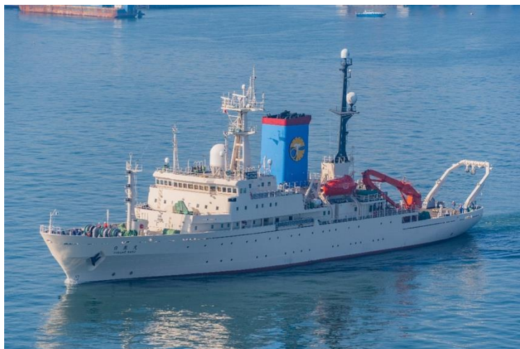
写真1：学術研究船「白鳳丸」